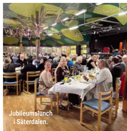
Jubileumslunch i Säterdalen.

Läs mer om hur det började i Historiska hörnan på sidan 19.