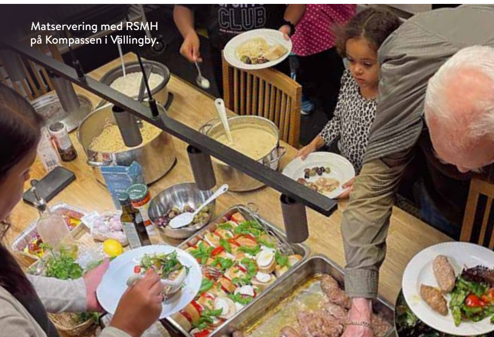
Matsservering med RSMH på Kompassen i Vällingby.