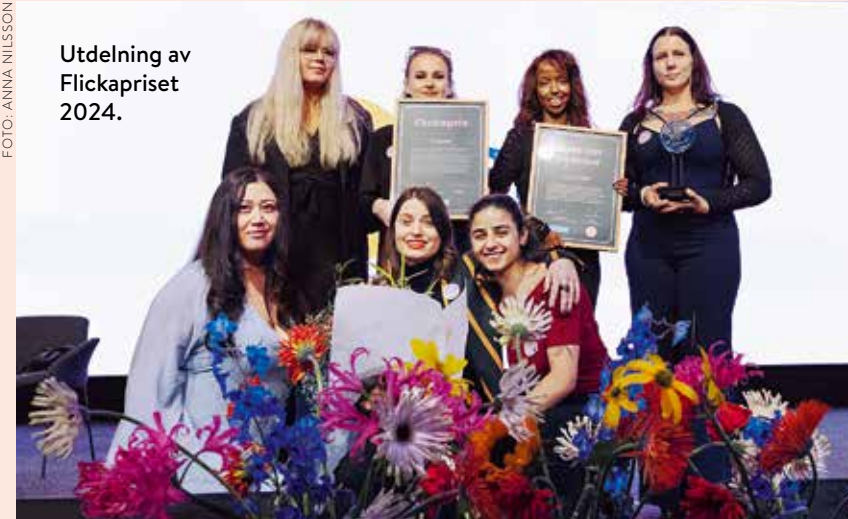
Utdelning av Flickapriset 2024.