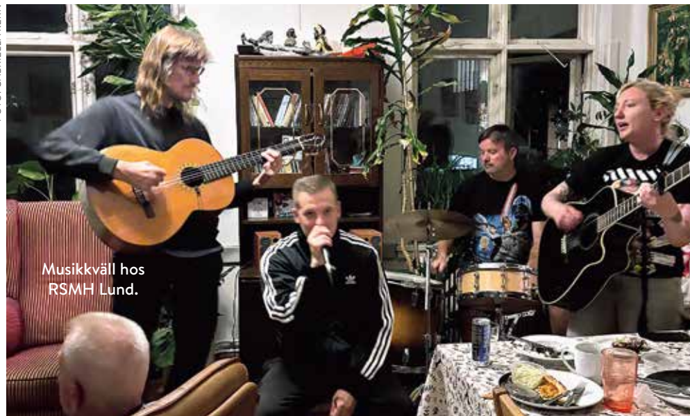
Musikkväll hos RSMH Lund.

människor. Att bjuda med grannen eller en ytlig bekant till lokalen för en fika, öppet hus, musikquiz eller en föreläsning.