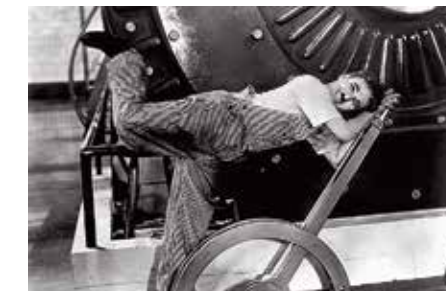
Charlie Chaplin från filmen Moderna tider.