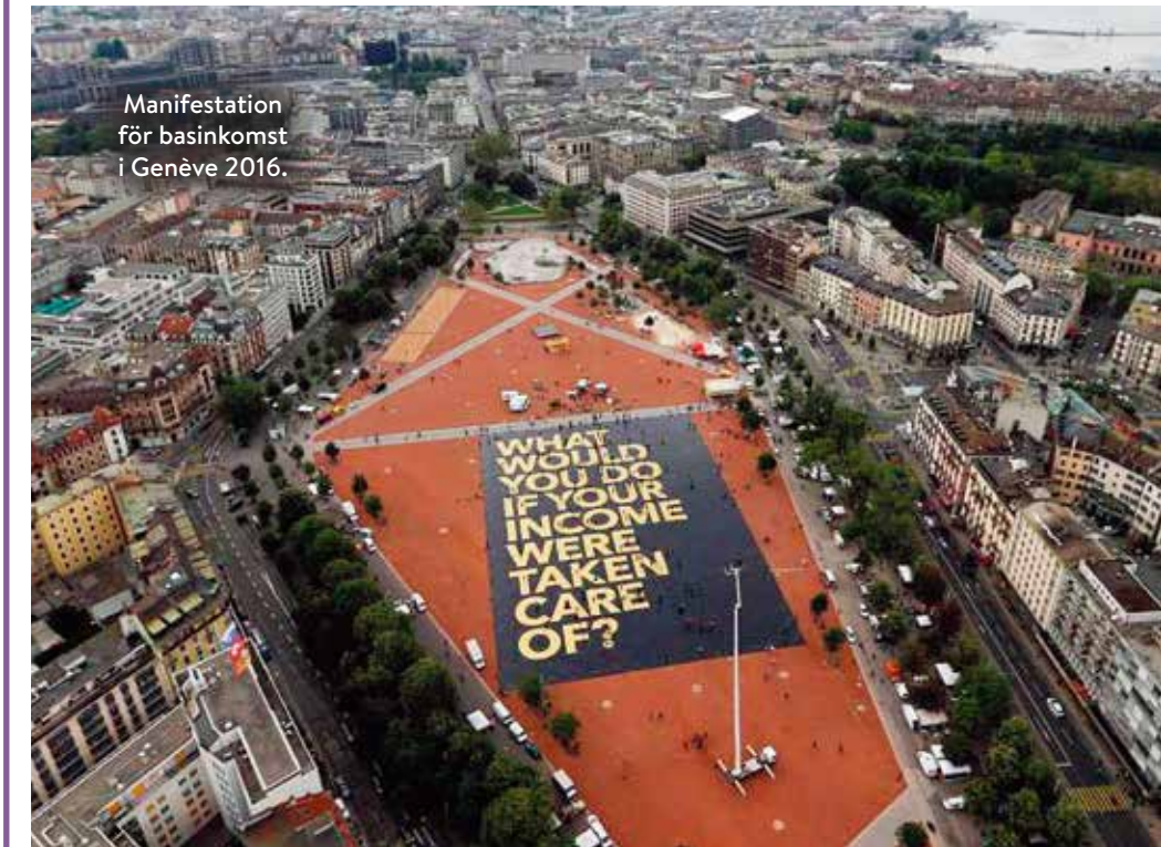
Manifestation för basinkomst i Genève 2016.

Fotnot: Artikeln publiceras i samarbete med tidningen Socialpolitik och finns sedan tidigare i år att läsa där.